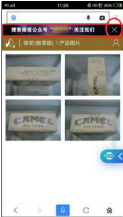
负面 case2: 标题后正文前嵌入广告