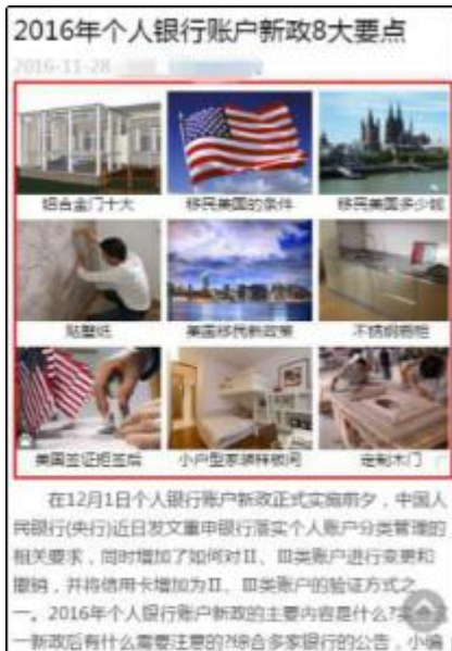
负面 case3: 正文中穿插广告